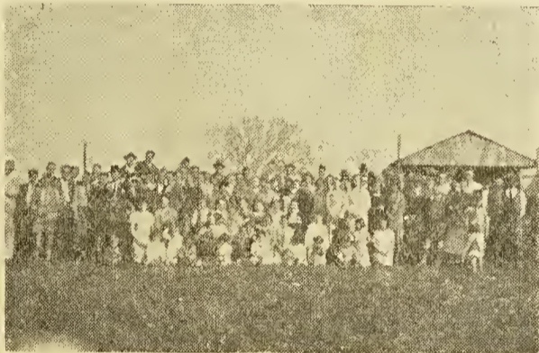
«Nin y Silva, el día de los festejos de su 10.º aniversario»